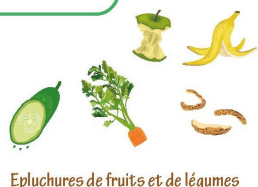
Epluchures de fruits et de légumes