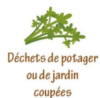
Déchets de potager ou de jardin coupés