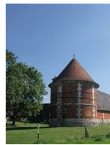
Manoir de Beaumont Bourneville-Sainte-Croix