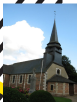
Eglise Bosguerard de Marcouville

Moulin de pierre à Hauville, Château de la Mésangère, Musée des Lampes Berger, Moulin Amour, Domaine cidricole des Hauts Vents, Maison de la Terre, Eglise Saint-Lô, Eglise Saint Pierre et bien d'autres !