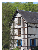
Moulin Amour Saint-Ouen du Pontcheuil