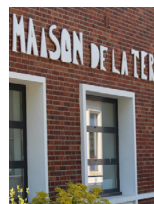
Maison de la Terre Bosroumois