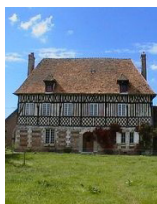
Domaine des Vents Saint-Ouen-du-Tilleul