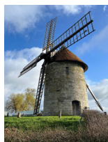
Moulin à vent de Pierre Hauville