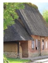
Four à pain La Haye-de-Routot